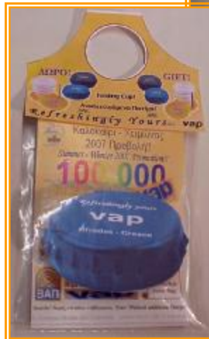
Αναδιπλούμενο Ποτήρι - Εξώφυλλο Καταλόγου Folding cups and sets - Catalogue Front Cover